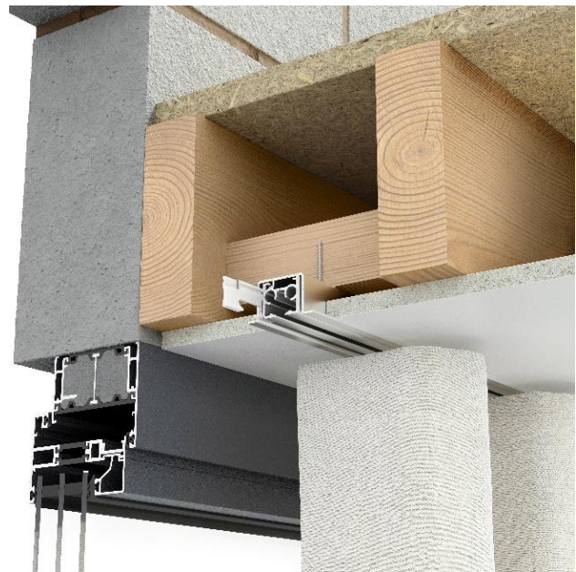
Inbouwprofiel + originele profiel + inzetstuk